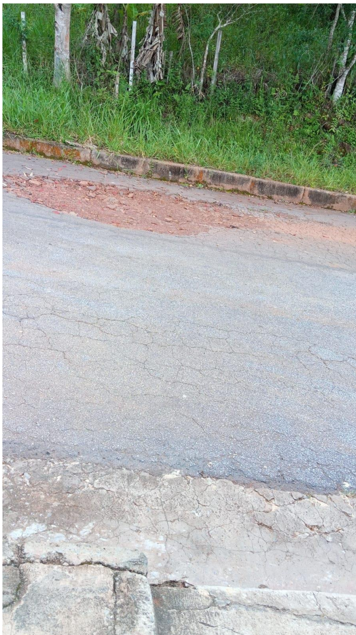
Tapa buraco Rua do Bananal esquina com Rua Maria Eulália Braga