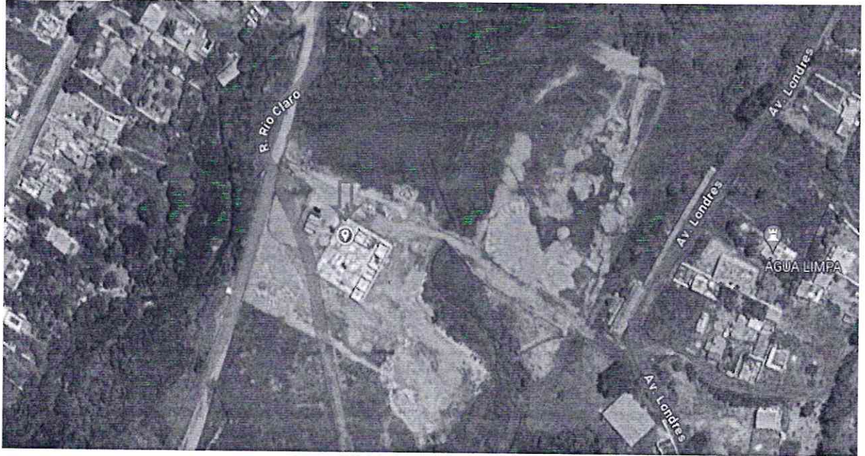
JUANITA DONADA FRANÇA (fotografia)